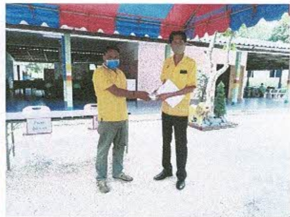
❖ ภาพการลงพื้นที่แจกทรายอะเบท (โรงพยาบาลส่งเสริมสุขภาพตำบล ทั้ง ๓ แห่ง)