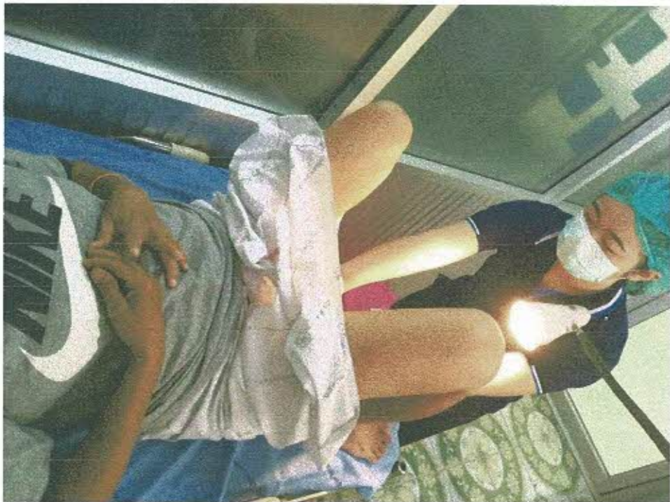
ตรวจคัดกรองมะเร็งปากมดลูก