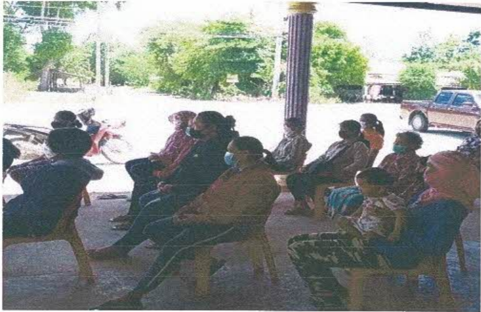
รณรงค์ให้ความรู้ในชุมชน โดย อสม.(แกนนำ)